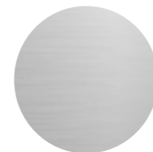
Inox massif sans présentation