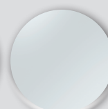
Inox massif lisse sans présentation esthétique (*)