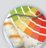
Teinte RAL (*)