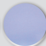
Inox lisse 304 L ou 316 L*