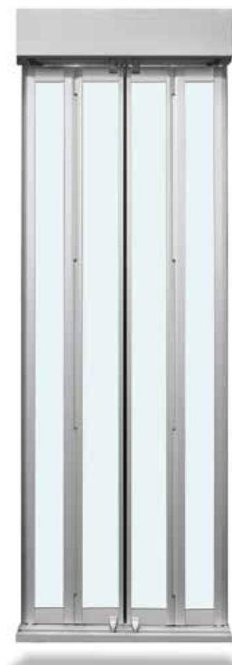
Encombrements porte de cabine 4 vantaux pliants vitrée