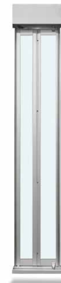
Encombrements porte de cabine 2 vantaux pliants vitrée