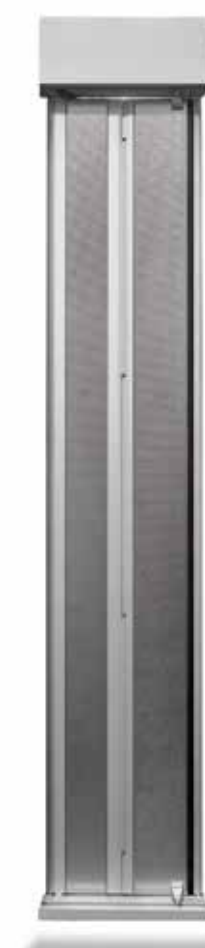
Encombrements porte de cabine 2 vantaux pliants tôlee